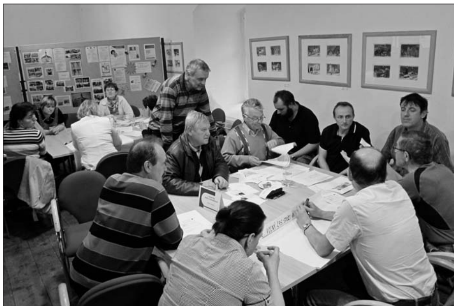
Fórum Zdravého města Jilemnice.

V samém závěru proběhlo losování několika šťastlivců, kteří si za účast odnesli balíčky fair trade výrobků nebo čajové pečivo jilemnického sociálního podniku Dva prameny.