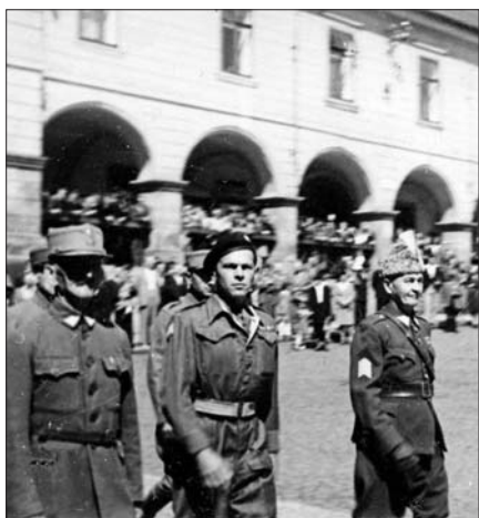
Na náměstí v Jilemnici 1945

přihlásili. Chtěli pomoci osvobodit svou rodnou zem.