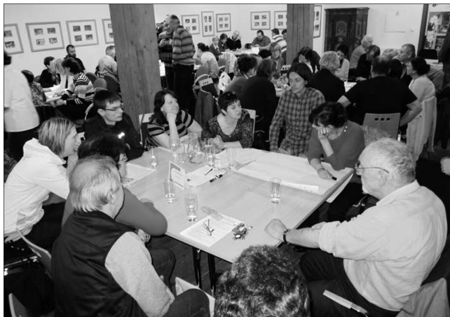
Fórum Zdravého města Jilemnice.

Erbovní sál: výstava Jiří Škopek: Poetická zastavení. Po několika letech se opět setkáváme s neobyčejně poetickými díly tohoto znamenitého umělce. Výstava se pro mimořádný zájem prodlužuje do 15. května.