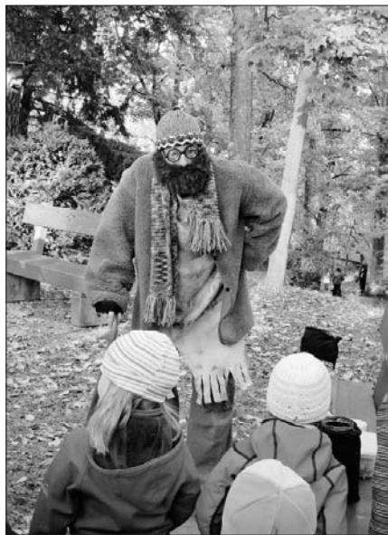
Z akce „Uspávání strašidel“, kterou uspořádalo Mateřské centrum.