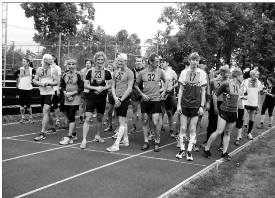
Start jilemnické hodinovky.