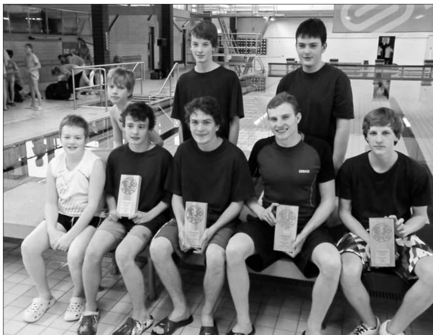
Jilemniční plavci na závodech ve Finsterwalde.

Naším cílem pak bylo dostat děti i na závody. Podařilo se to poměrně brzy, po necelém půlroce tréninku. Trutnovský bazén zažil naši velkou premiéru