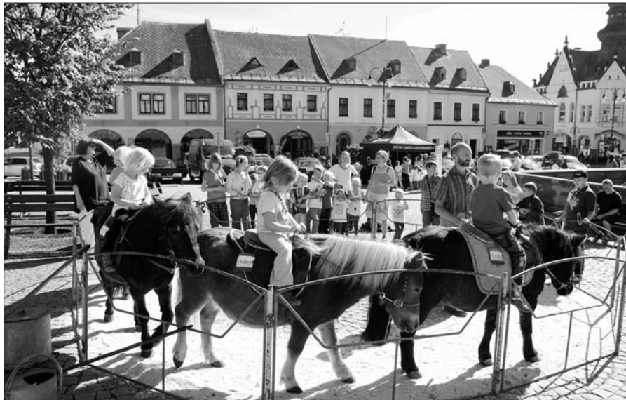
Den bez aut.

V odpoledních hodinách byly vyhlášeny výsledky výtvarné soutěže „Památky znovuzrozené“. Pro sportovčtivé byla připravena soutěž „Nejrychlejší pytel“, kde každý soutěžící, který skokem v pytli absolvoval určenou trasu, získal diplom a sladkou odměnu. Pomyslným zlatým hřebem celého dne byla ukázka