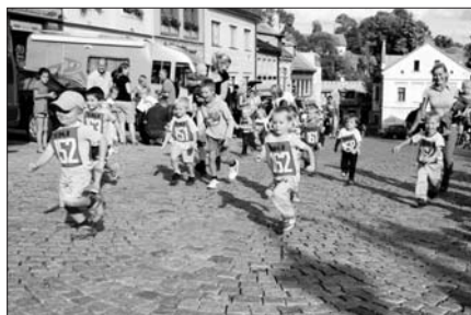
Lízátkový běh pro nejmenší.

Doprovodnými závody jsou v posledních letech také tradiční běh zámeckým parkem pro žactvo, tento závod byl v letošním roce součástí krajského poháru Libereckého kraje v přespolních bězích žactva a lízátkový běh pro předškolní chlapce a dívky. Závody žactva startovaly intervalovým startem, což je pro