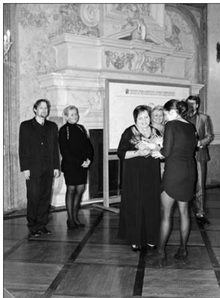
Ocenění Dětského centra. Z archivu DC.

Byl to pro nás velmi radostný, emotivní, nepopsatelný zážitek.