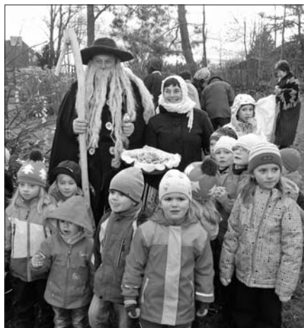
Vítání Krakonoše. Archiv TJ Sokol Jilemnice

Když jste pohlédli v neděli 24. listopadu před druhou hodinou odpolední směrem k Žalému, mohli jste spatřit Krakonoše, který si to směřoval přímo k Jilemnicí. Přišel se zase po roce podívat na naše děti. Když se Krakonoš blížil k zámeckému parku, pořádně foukalo, ale na chvíli zvědavě vykouklo i sluníčko. Krakonoše doprovázela pouze Anče. Kuba letos musel zůstat na horách a připravovat dříví na otop, jelikož se prý očekává tuhá zima. Na Krakonoše se přišlo podívat kolem sto třiceti dětí s rodiči a prarodiči a ten měl velkou radost, že se jich na něj těšilo tolik. Vřele se s nimi přivítal a poprosil je, aby mu pomohli roztřídit obrázky zvířátek, které se mu cestou pomíchaly. Děti pěkně všechna zvířátka roztřídily a ještě se přiučily, jaké zvuky které zvířátko vydává. Na oplátku jim Krakonoš za jejich pomoc rozdával dřevěné knoflíky, které sám za dlouhých zimních večerů vyrobil. Děti ještě pomáhaly s výrobou krmítka pro ptáčky. To potom odnesly do mateřské školy na sídlišti, aby tam měly kam ptáčkům v zimě sypat zrní a semínka. Anče si také pro děti připravila úkol. Poznávaly, co se dává zvířátkům v zimě do krmelců. Byla překvapena, kolik toho ty malé děti vědí. Jako odměnu od ní získaly ručně zdobený perníček, který