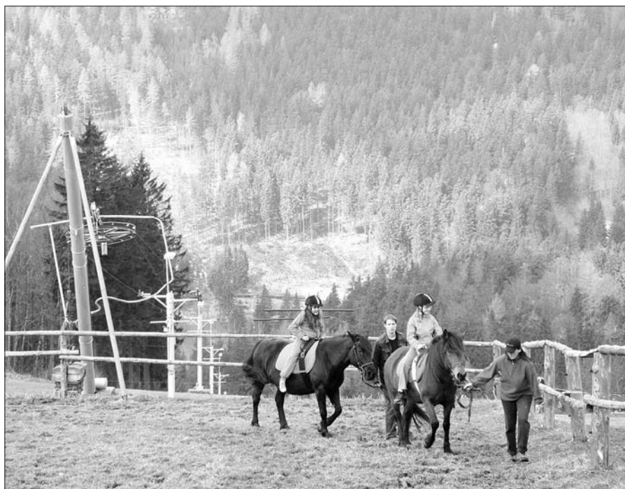
Na Janově hoře.