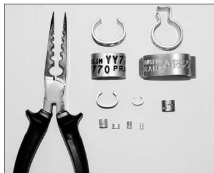
Několik základních typů kroužků s kroužkovacími kleštěmi. Foto L. Petrilák ml.

kroužkovatel učitel místního gymnázia Jindřich Vodička ve 30. letech minulého století. Od té doby zde kromě mé osoby asi nikdo nebyl. Nejbliže ještě v této