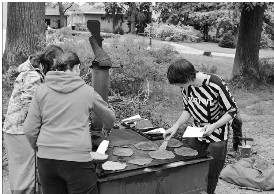
Brambory a kaše, to je strava naše!

Realizátorem projektu „Pracujeme s nadanými žáky i s žáky ohroženými předčasným odchodem ze vzdělávání“ je Vzdělávací centrum Turnov, o. p. s. Projekt je zaměřen na podporu rovných příležitostí žáků, věnuje se jak žákům