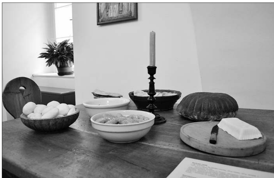
Z expozice výstavy Brambory a kaše, to je strava naše.