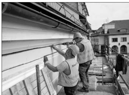
Provádění podélného ztužení.

K tomuto kroku bylo přistoupeno především proto, aby se efektivně využilo již postavené lešení a nemuselo se budovat později znovu jen pro tento účel. Na průčelí radnice se již delší dobu vyskytovaly svislé trhliny, především v místech kolem oken a nad oblouky podloubí. V osmdesátých letech při rekonstrukci radnice bylo provedeno statické ztužení v příčném směru pomocí táhel, podélný směr nebyl tehdy řešen. Postupem času se objevily trhliny na vnějším plášti objektu, ty se nyní zajišťují. Ztužení provádí specializovaná firma Stati-CAL z Ústí nad Labem, která je schopná provést podélné ztužení s minimálním zásahem do stavebních konstrukcí historického objektu radnice ve velmi krátkém čase a s vysokou životností použitých prvků. Jedná se o systém nerezových táhel šroubovitého tvaru, jehož tradice sahají až před válečné období, kdy byl podobný typ výztuží užíván při výstavbě železobetonových opevnění. Výztuž je válcována za studena z válcovitého průřezu, stočením vznikne v průřezu předpětí, zvýší se pevnost v tahu a výztuž se poté chová jako silná stočená pružina. Nejprve je nutné