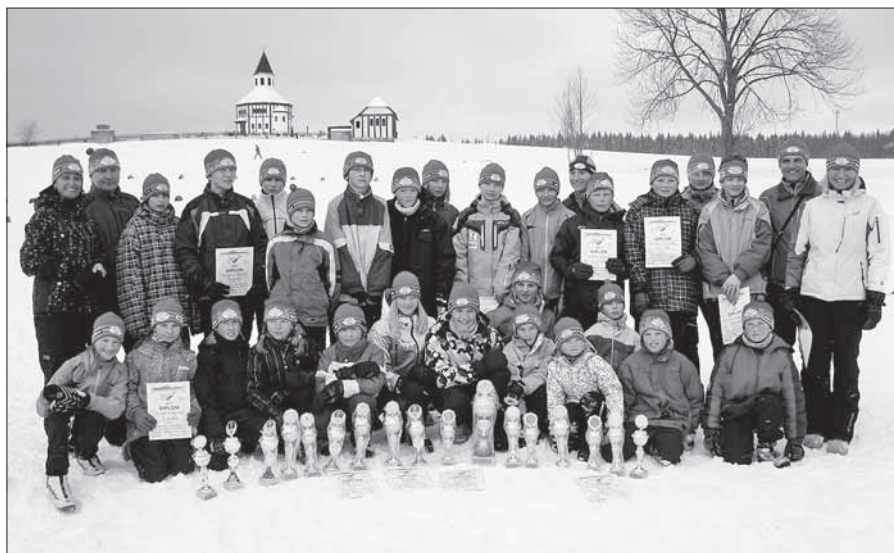
Pohár Libereckého kraje – 1. místo: ČKS SKI Jilemnice.