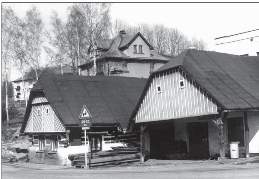
Jilemnické proměny: Křižovatka Žižkovy a Krkonošské ulice dříve a nyní.