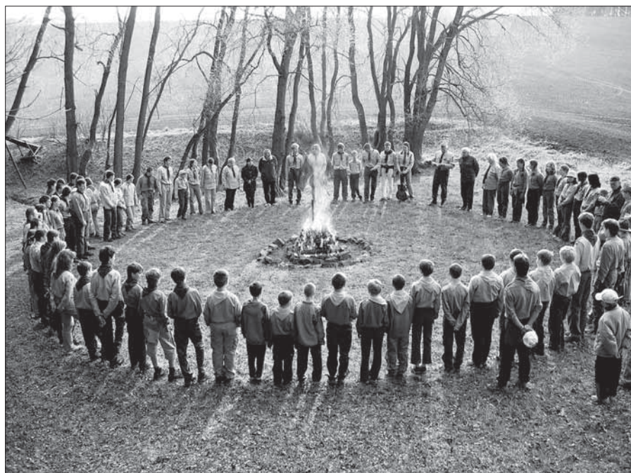
Z oslav 20. výročí obnovení jilemnického Junáka.