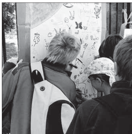
Den Země 2009.