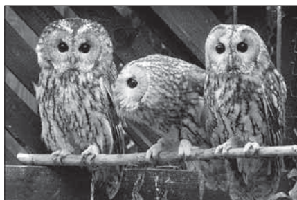
Z fotoarchivu ČSOP Jaro Jaroměř

Jak poznat pušťíka od ostatních sov? Je zde pár velmi typických znaků. Hlavním znakem by mohla být černá barva očí, kterou má pouze pušťík a sova pálená. Dále se zbarvení pohybuje od hnědého k šedému se strakatým vzorem, zatímco již zmíněná sova pálená se odlišuje běžově hnědým nestrakatým zbarvením a srdčitým výrazem v obličejí. Celkově pušťík působí zavalitě s velkou hlavou.