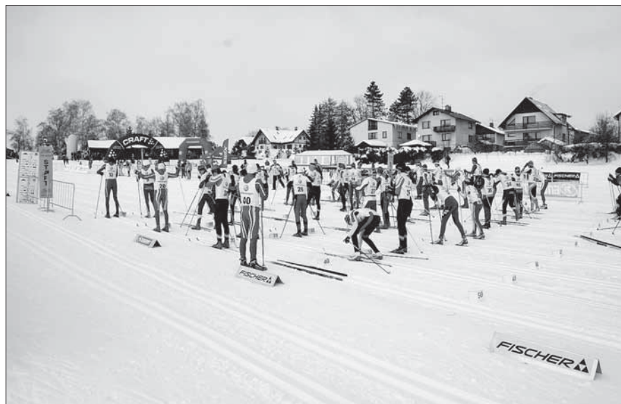
Start závodu únorového Mistrovství ČR dorostu (Hraběnka).

Jakým způsobem probíhá zveřejňování jubilatů v měsíčníku Jilemnice zpravodaj města? — Spolupracovnice matriky vždy na začátku měsíce obdrží seznam jubilatů v aktuálním měsíci. Podle tohoto seznamu postupně (podle data narození) navštěvuje jubilanty, jménem radnice jim popřeje, předá balíček s gratulací a zároveň si od jubilanta nechá podepsat formulář, zda souhlasí s uveřejněním svého jubilea ve zpravodaji. Na počátku měsíce má redakce k dispozici seznam jubilatů a souhlasy ke zveřejnění za uplynulý měsíc. Protože mě-