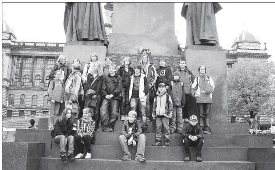
Přírodovědný kroužek na výletě v Praze.

Na jaro připravujeme procházku po Riegrově stezce nedaleko Železného Brodu a školní rok završíme víkendovým bytem na Rýchorské boudě, kte-