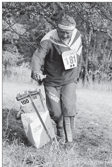
Letní sezóna začíná...