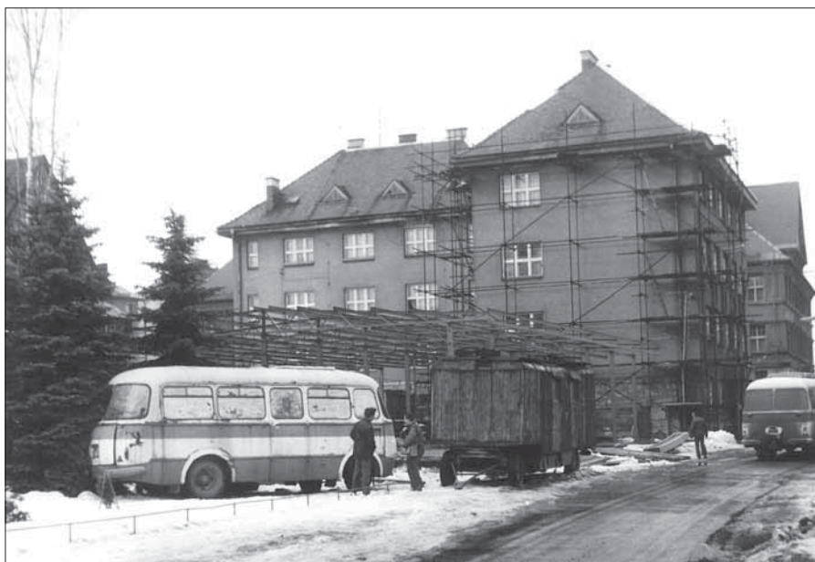
Jilemnické proměny: Dům čp. 205 (1980/2009).