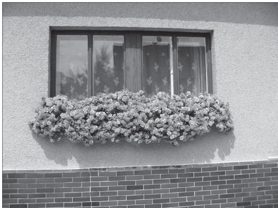
Soutěž „Jilemnice krásná a rozkvetlá“ – V domkách.

Nejvíce soutěžních snímků se nahromadilo v kategorii rodinné domy . Na