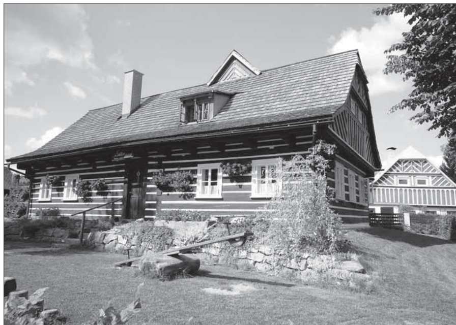
Soutěž „Jilemnice krásná a rozkvetlá“ – Šaldův statek.