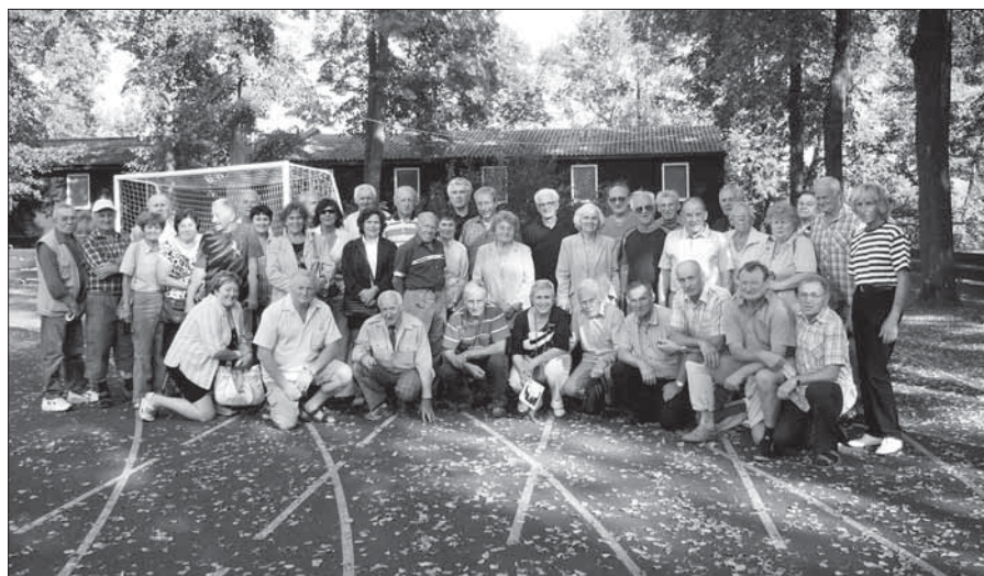
Ze setkání atletů.