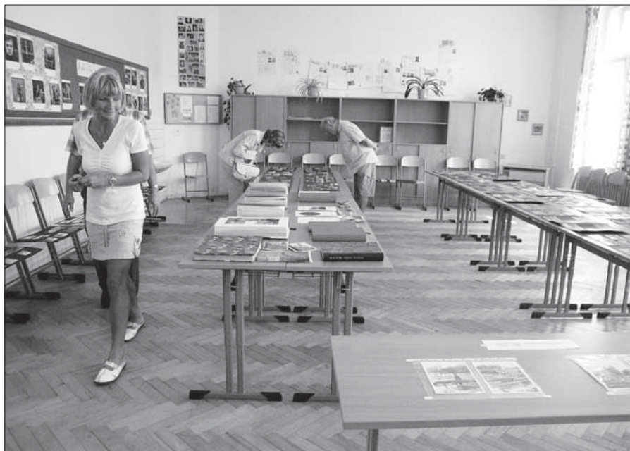
Dny evropského dědictví – výstavka ke 110. výročí ZŠ Komenského.

Přízemí budovy čp. 1 – hospodářské budovy v areálu bývalého pivovaru – si