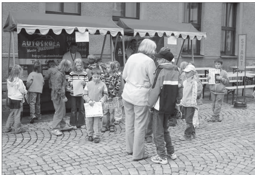
Den bez aut.