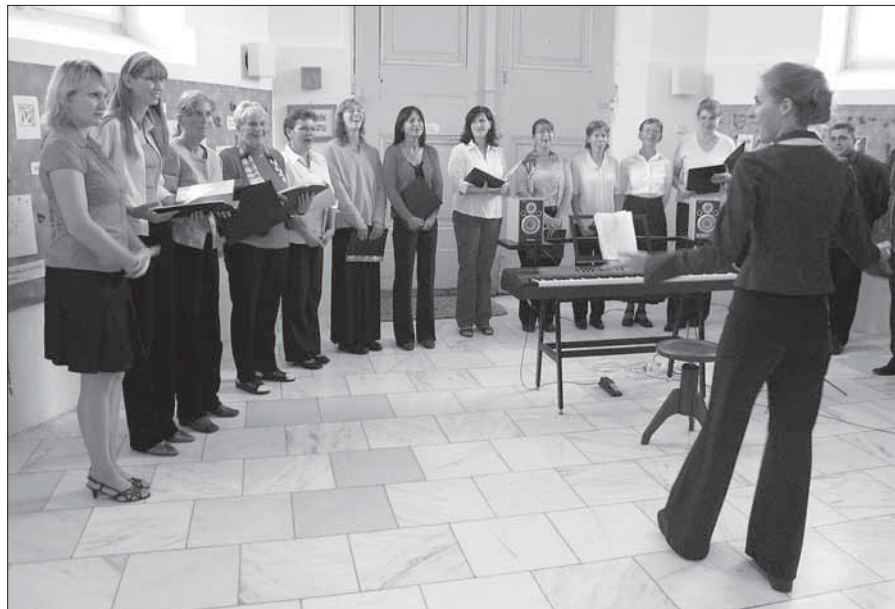
Dny evropského dědictví – vystoupení pěveckého sboru Camponotus.

(Vypsáno z městské kroniky.) Vybral a v nezbytné míře upravil J. Luštinec