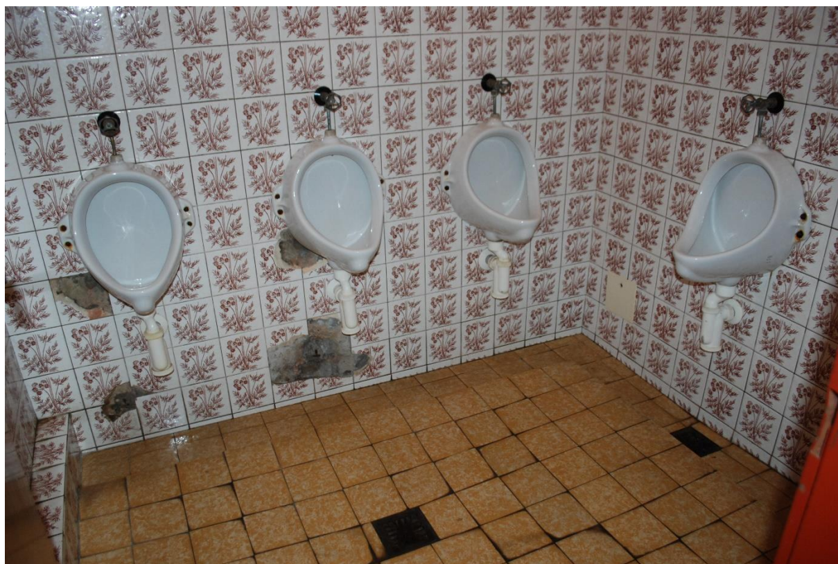
Některé WC kabiny prošly rekonstrukcí naposledy v 70. letech. I s jejich přestavbou se v projektu počítá.

Bezbariérové budou také WC kabiny. „Záchody tu nejsou v moc dobrém stavu, na některých patrech prošly poslední rekonstrukcí odhadem tak v 70. letech minulého století,“ poukazuje ředitel ZŠ a dodává, že bezbariérové WC kabiny by měly být podle projektu vybudovány v každém patře. V prvním a druhém patře bude jejich součástí navíc také hygienická kabina a koupelna se sprchou.